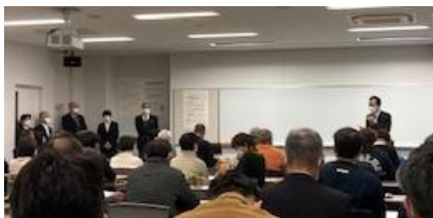
審判研修会開講式

◆日本インディアカ協会会員情報管理の変更 個人情報取り扱い強化ため、会員の登録情報管理をケンスポコムを利用した管理体制に移行しました。